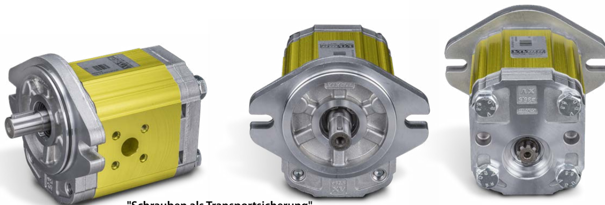
"Schrauben als Transportsicherung"

Frontflansch: Alu Körper: Alu Anbaufansch: Alu